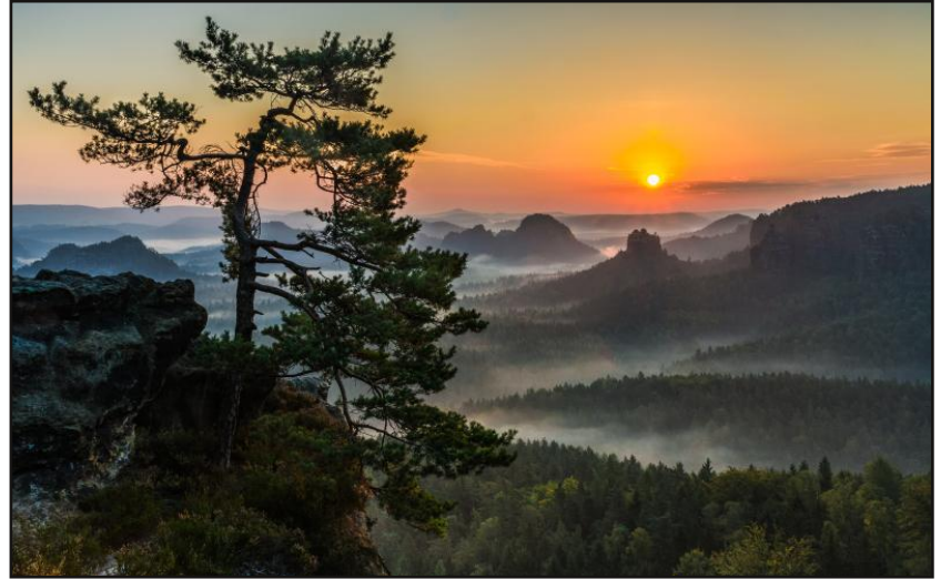
Klaus Frauenhoff (Reflexion '90 Erfurt) belegte mit dem Bild "Morgens im Elbsandsteingebirge" den ersten Platz im Mappenwettbewerb 2015-16.