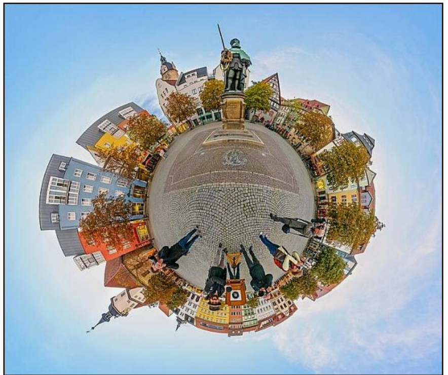
1. Platz im Sonderwettbewerb "Rund" des 20. Mappenwettbewerbs: Arbeit des Jenaer Fotoclubs

Der Einsendeschluss des 23. Deutschen Fotowettbewerbs ist dieses Mal der 4. Februar 2017 . Die Ausstellung wird am 19. März 2017 in Berlin eröffnet.