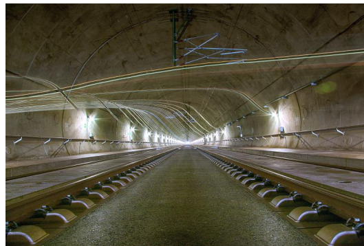
3. Platz (67 Punkte) Simone Hopf (Fotoclub Reflexion '90 Erfurt) Lichtbahnen