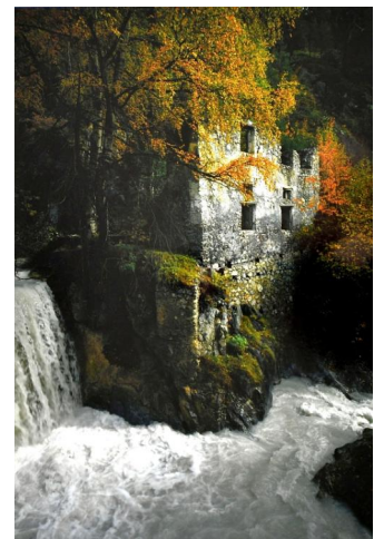
3. Platz (67 Punkte) Günther Kühnl (Fotoklub UNIFOK Jena) Romantisch