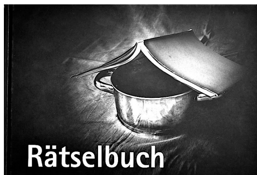
1. Platz (82 Punkte) Fotoclub Reflexion '90 Erfurt (Abbildung links)