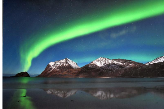
1. Platz (71 Punkte) Florian Brill (Jenaer Fotoclub) The Green Mile